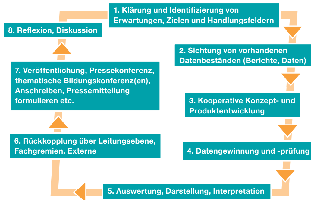
Abbildung 2: Arbeitsschritte des kommunalen Bildungsmonitoring

Die folgende Abbildung veranschaulicht beispielhaft, wie das Bildungsmonitoring in verwaltungsinterne Abstimmungsprozesse und Kooperationsstrukturen mit externen Akteuren eingebunden ist.