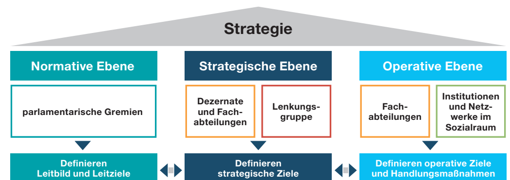
Abbildung 2: Einbettung der Strategieformulierung in kommunale Entscheidungsstrukturen