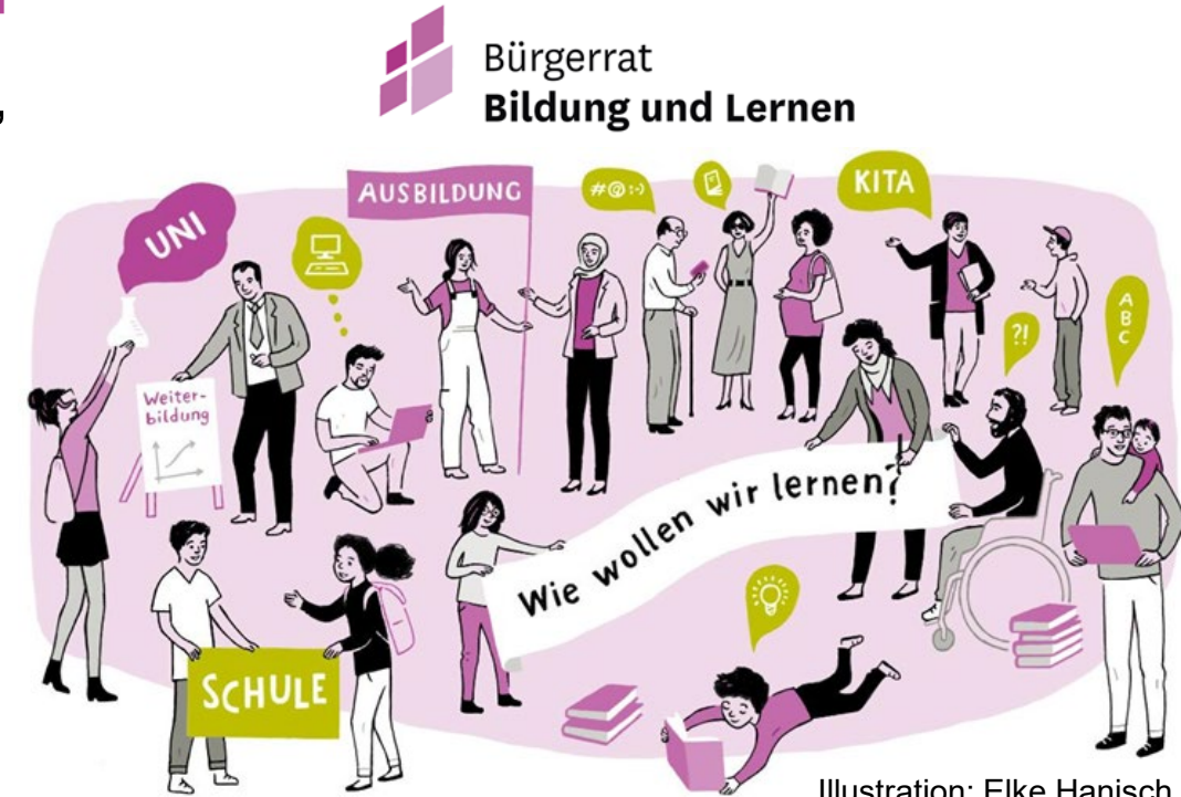
Illustration: Elke Hanisch